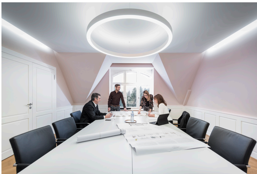
Die Villa Boveri fördert visionäres Denken. Die insgesamt elf Sitzungs- und Seminarräume sind mit modernster Technik ausgerüstet und im historischen Esszimmer wird stilvoll gespiessen.